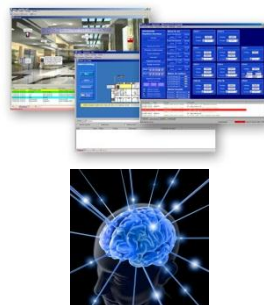
Informatie management, configuratie, beheer en bediening